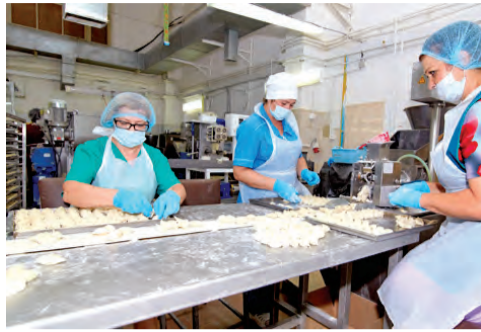
Коммуналку — на грешную землю

Круглые столы, как правило, посвящены животрепещущим темам. Возьмем, к примеру, набившую оскомину проблему взаимоотношения управляющих компаний и собственников помещений в многоквартирном доме с организациями, снабжающими ресурсами. Взаимобвинений пруд пруди. Всех участников обсуждения предстояло вернуть на грешную землю: есть договор — есть услуга, определен порядок взаиморасчетов — чего проще? Но пробуксовка во взаимоотношениях очевидна и в итоге режет качество и повышает стоимость жилищно-коммунальных услуг.