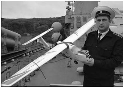
...и оптимального применения в морском сражении, обеспечить высокую боеготовность кораблей и эскадры ТОФ.

Как всегда гостеприимно распахнул двери малый зал Владивостокского Дома офицеров. Многие участники форума давно знают друг друга. Поэтому выйдя из аудитории, они обмениваются не только дружелюбными приветствиями, но и новостями в мире техники. Кто-то поделился своими мыслями, рассказав, над чем сегодня работает. Чувствовалось, что собрались единомышленники, заинтересованные в том, чтобы умения, способности и талант отдавать главному - повышению боевой готовности родного флота.