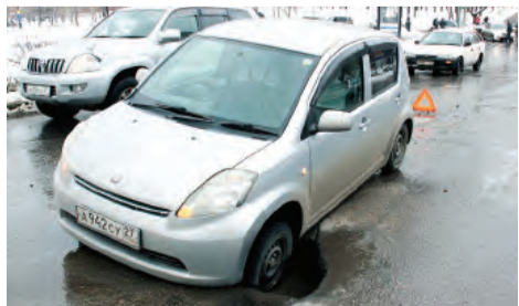
Уссурийский бульвар: угодил в яму