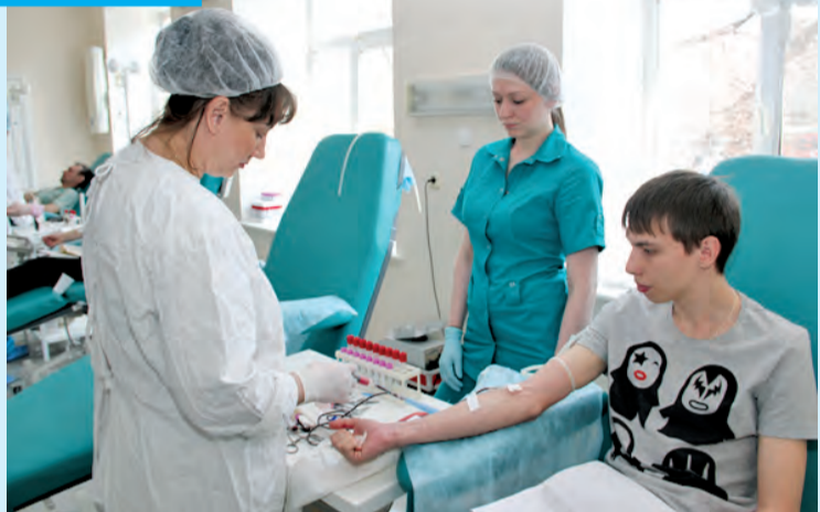
В рамках акции «Весенняя неделя добра» хабаровчане приняли участие в Дне донора. На станцию переливания крови пришли 198 горожан, большинство из них студенты. Кроме традиционной выплаты за сдачу крови в 200 рублей, каждый из доноров получил от организаторов акции сладкий подарок и сувенир.