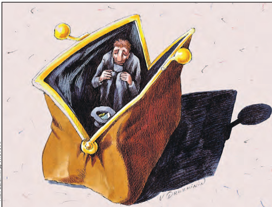
Рис.: Валентин ДРУЖИНИН

Sberbank CIB (это инвестиционная компания, лондонская дочка Сбербанка) опубликовала шокирующее исследование. Экономисты заглянули в кошельки российского среднего класса. И узнали, что он живет не хуже, а в чем-то даже лучше европейцев. Но при этом люди жизнью страшно недовольны, ноют и хотят валить из страны. Почему деньги не приносят нам счастья?