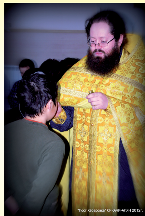
"Пост Хабаровка" СИКАЧИ-АЛЯН 2012г.

Невозможно переоценить значение деятельности епархии по освоению и становлению жизни на новых землях. Тысячи переселенцев из европейской части Российской империи несли в осваиваемые земли православную веру и делились ею с местными жителями. Монастыри, церкви, часовни и моленные дома приобщали население к основам православия и русской культуры. Этому способствовали и приходские школы, открытые как для русских детей, так и для детей аборигенов. К концу XIX в. в Приамурье функционировало 18 школ для инородцев с 389 учащимися. Одной из первых официально зарегистрированных миссионерских школ была Хабаровская. Священнослужители способствовали распространению книжной культуры среди населения Дальнего Востока, в