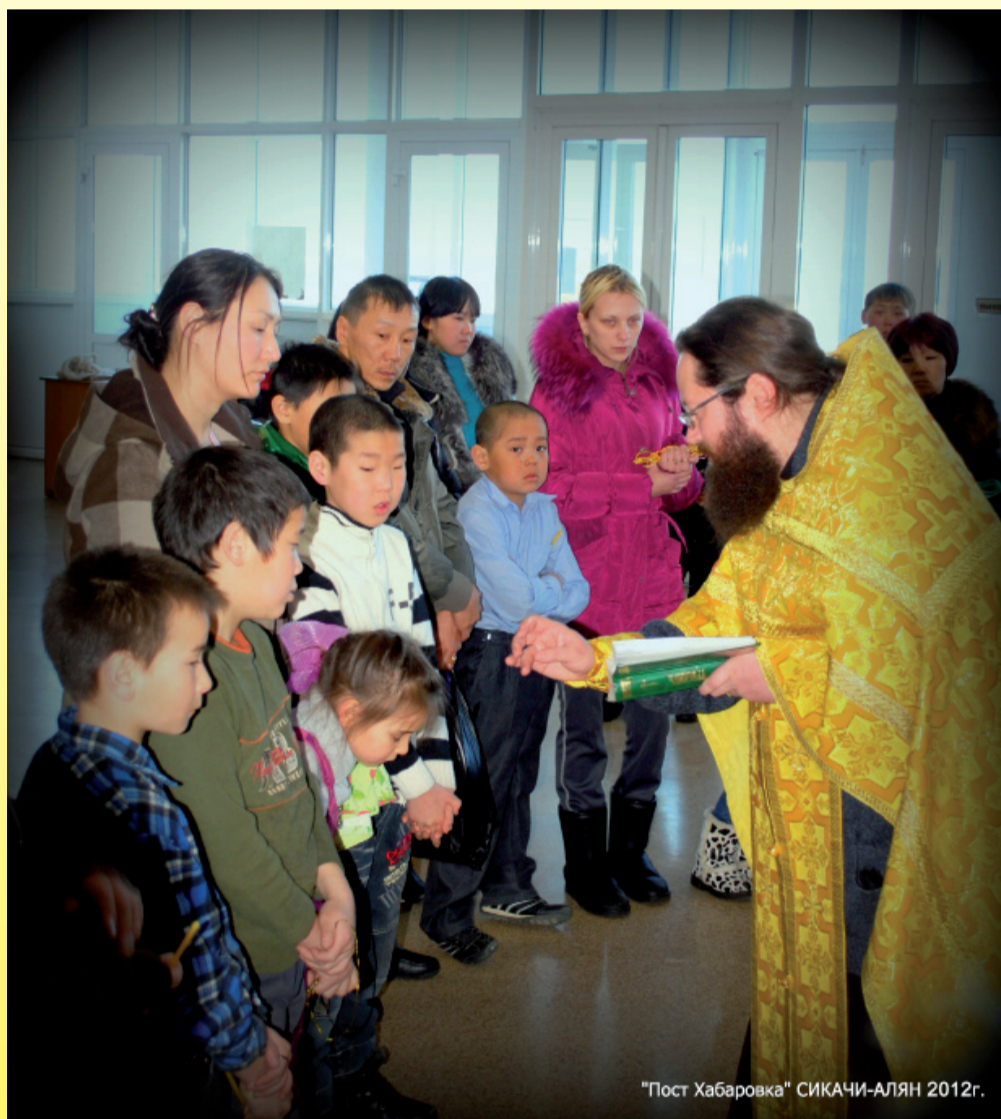
"Пост Хабаровка" СИКАЧИ-АЛЯН 2012г.

Камчатскую. Большая часть территории нынешней Хабаровской епархии оказалась с того времени в ведении Благовещенских архиереев. За время существования Благовещенской епархии во главе ее находились очень деятельные архиереи: Иннокентий (Солодчин) (9 февраля 1899 — 24 сентября 1900), еп. Никодим (Боков) (17 декабря 1900 — 03 ноября 1906), еп. Владимир (Благодарумов) (3 ноября 1906 — 22 мая 1909), еп. Евгений (Бережков) (22 мая 1909 — 11 июля 1914), Евгений (Зернов) (11 июля 1914 — 13 августа 1930).