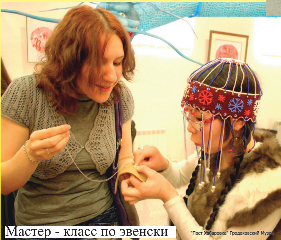
Мастер - класс по эвенски

Деление года на месяцы определяли по частям тела, начиная с правой руки: начало года - сентябрь (ойчири унма - «поднимающаяся тыльная поверхность кисти руки»), октябрь (ойчири билэн - «поднимающееся запястье»), ноябрь (ойчири ечэн - «поднимающийся локоть»), декабрь (ойчири мир - «поднимающееся плечо») и т. д. Затем счет месяцев переходил на левую руку и шел по ней в нисходящем порядке: февраль (эври мир - «спускающееся плечо») и т. д. Январь (тугэни хэ) и июль (дюгани хэ) называли