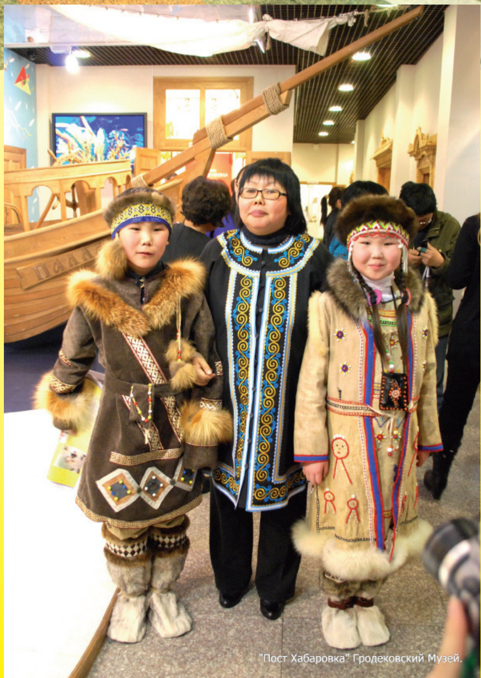
"Пост Хабаровка" Гродековский Музей.

В 20-е годы прошлого столетия на Дальнем Востоке проводилось новое административно-территориальное