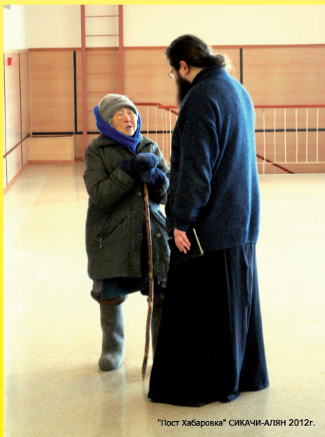
"Пост Хабаровка" СИКАЧИ-АЛЯН 2012г.

В 1910 г. недалеко от Хабаровска, близ села Архангеловка, что на р. Тунгуска, был открыт мужской общежительный монастырь в честь Феодоровской иконы Божией Матери. Первым настоятелем обители стал её строитель иером. Иоасаф (Крупенин). А в 1914 г. его сменил приехавший из московского