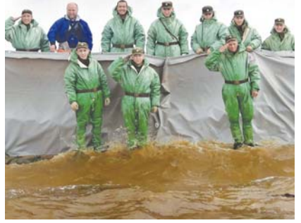
К примеру, в Доме ветеранов на улице Льва Толстого, введённом в эксплуатацию к 55-летию Победы, живут 135 человек. Это участники войны, труженики тыла, герои участников войны, ветераны труда. Для них работает 92 сотрудница. Содержание только этого учреждения на 2013 год составляет 36 млн. рублей.

Его победил Владимир ШПОРТ.