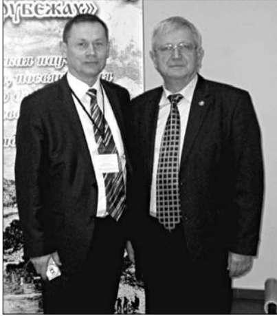
Сахалин - остров!

«Байкал», пробив в пути более восьми месяцев, 12 мая 1849 года вошел в Амурский бухту и бросил якорь в Петропавловской гавани. Невельский долгие часы начал Главного морского штаба адмиралу князю Меньшикову о прибытии транспорта в Петропавловск в совершенной исправности, со здоровой и бодрой командой. «После сдачи груза в порту, - писал Невельский, - я решился отправиться прямо к южному берегу Сахалина и Амурского лимана». 30 мая «Байкал» высадился в Охотское море.