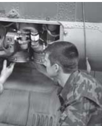
Работники авиационно-технического училища в процессе ремонта вертолёта.

Наша специалисты за время экспедиции ПДН-70 не пропустили ни одного дефекта на вертолётной технике. Все возможные трещины, коррозии, разрывы металла выявлены своевременно и устранены специалистами группы регламента и ремонта планера и средств наземного обслуживания вертолётов. Но времени на проведение соответствующих работ уходит гораздо больше.