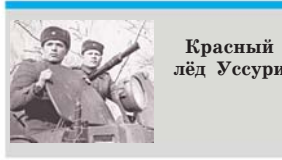
Красный лёд Усури