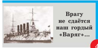
Врагу не сдаётся наш гордый «Варяг»...