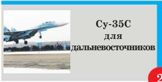
Су-35С для дальневосточников