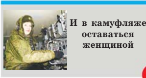
И в камуфляже остаются женщиной