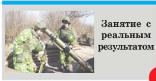
Занятие с реальным результатом