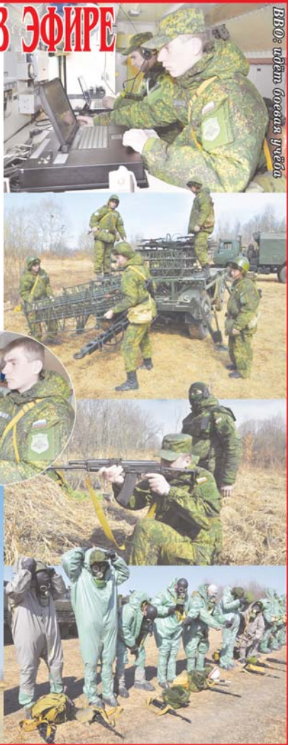
ВВО: этап боевого учения

больше восьми месяцев, а уже считается состоявшимся специалистом. - О службе в войсках РЭБ на «гражданке» я, конечно, не задумывался, - сказал военнослужащий. - Во многом на мой распределение повлиял диплом Дятковского индустриального техникума. Привянься, ни разу об этом не пожалел. После учебного подразделения в Тамбове я был направлен для прохождения службы в бригаду РЭБ ВВО. Специальность интересная, ответственная. Аппаратура современная, требующая знаний и оперативности склад ума. Не случайно я всерьёз задумался о военной службе по контракту. Командир подразделения охарактеризовал военнослужащего как ответственного и инициативного специалиста. Таким в бригаде РЭБ ВВО всегда рады, ведь именно они составляют здесь главный костяк подразделения. Олег СУРОВЦЕВ.