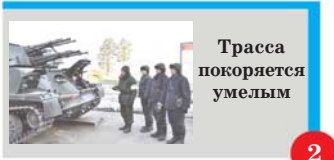
Trassa покоряется умелым