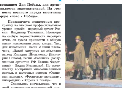
Артисты Драматического театра ВВО на сцене.