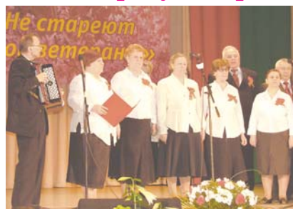
«Не стареют красивые души» - конкурс песен ветеранов...