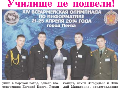
Ученики и учителя в момент награждения.