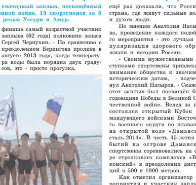
Участники заплыва в честь Дня Победы в Хабаровском крае.