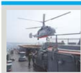
Под знаком Индры