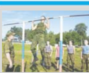
Четверо «стариков» и одна девушка