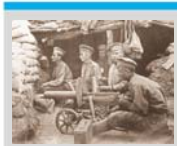
На пути к глобальному конфликту