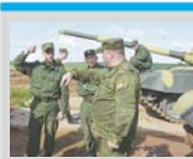
Задача - сплотить коллектив