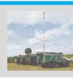
Войска без связи не остались