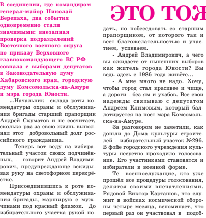
Андрей Владимирович, а чего вы ожидаете от нынешних выборов как житель города Юности?