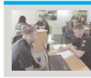
Верный выбор - служба по контракту