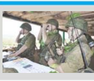
Последние штрихи перед учением