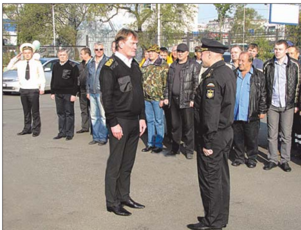
государственной политики в Заполярье, трёхмесячной зимой.

Это было начало большой плановой работы, которая открывала новые перспективы для развития этого района Мирового океана. Со временем многое изменилось: принята стратегия развития Арктической зоны до 2020 года. Активно развивается законодательное оформление приоритетов и направлений