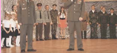
участников концерта артильный зал несколько раз вставал.

И такие чувства испытывала не только она. Во время выступления