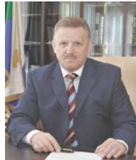
Губернатор Хабаровского края Вячеслав ШПОРТ.