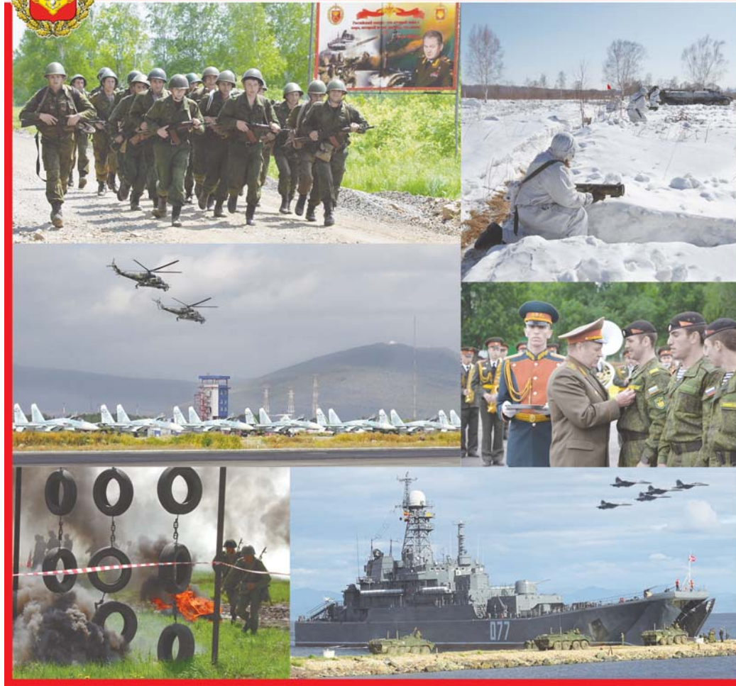
● Армия и общество