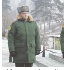
забайкальцам, погибшим в Афганистане, установленном в парке ОДПРА. У памятника во все времена года не увядают цветы...