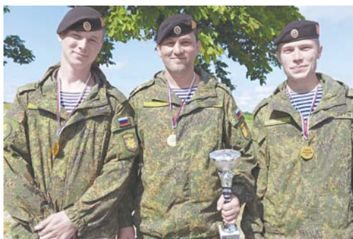
Экипаж-победитель командных соревнований.

- Было небольшое волнение, - говорит он. - Потому что знаешь, что есть соперники, которые мо-