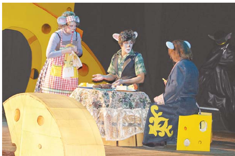
Фото из архива театра.