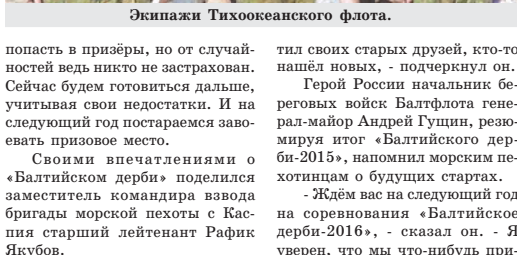
Экипажи Тихоокеанского флота.

- Не получилось, потому что остальные просто были лучше, - словно успокаивает он себя. - У каждого экипажа были ошибки, недочёты. У нашей машины сломался кардан, поэтому и не смогли финишировать. Мы могли бы