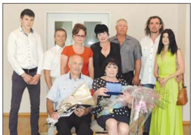
г. Фокино.

Несколько дней скамья примирения простоят у входа в загс, а впоследствии этот символ в соединении влюблённых будет перенесён в городской парк, где, несомненно, найдёт себе применение.