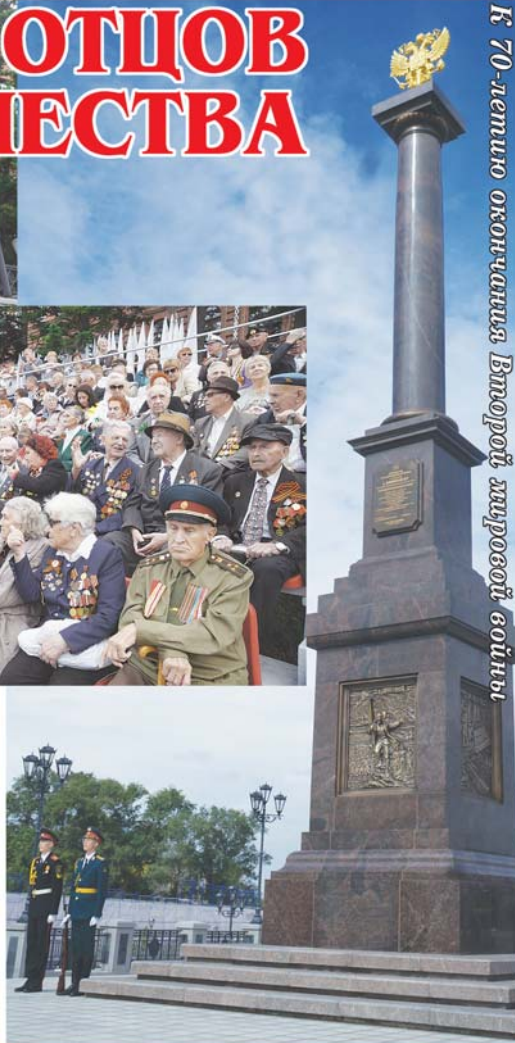
К 70-летию окончания Второй мировой войны