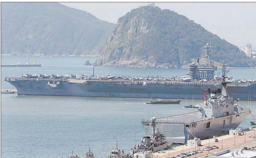
Вооруженные силы США и Южной Кореи проводят беспрецедентно крупные военные учения по уничтожению северокорейского руководства в случае войны, на что КНДР уже отреагировала угрозой превентивного ядерного удара.

Как передало из Сеула агентство «Рёнхал», штабные учения «Ки ризоль» (Key Resolve) прошли неделю, а полевые манёвры «Токсури - Фоул игл» (Foal Eagle) - до конца апреля и задействуют 300 тысяч военнослужащих Южной Кореи и 17 тысяч американских солдат - вдвое больше, чем в прошлом году. На время учений в Южную Корею перебросен атомный авианосец John C. Stennis, атомная подводная лодка и бомбардировщик-невидимка В-2.