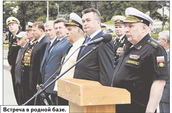
Встреча в родной базе.

Бесплатно и навсегда - на таких условиях Сирия предоставила российским ВКС эту авиабазу. В договоре между Россией и Сирией, опубликованном на официальном портале правовой информации России, так и написано: бесплатно и безвозмездно. Чудес, конечно, не бывает, условия, возможно, когда-нибудь будут пересмотрены. И всё же велика вероятность, что Хмеймим станет нашим «непотопляемым авианосцем» в Средиземном море. Удивительно, но после публикации текста договора гневных комментариев со стороны «стратегических партнёров» не последовало. Похоже, необходимость российского военного присутствия в Сирии даже на Западе ни у кого не вызывает сомнений.