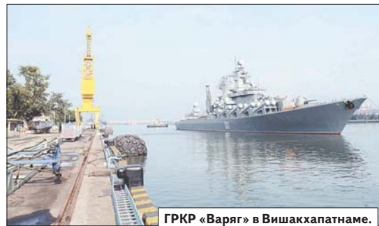
ГРПК «Варяг» в Вишакхапатнаме.

ВМФ России вернулись сюда, потеснив американский флот, покочив с его безраздельным господством в Средиземном море.