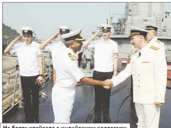
На борту крейсера с индийскими коллегами.

в Средиземном море, сегодня можно утверждать, что Российский флот уверенно возвращает былые позиции. Здесь несли вахту и атомный тяжёлый ракетный крейсер «Пётр Великий», и тяжёлый авианесущий крейсер «Адмирал Флота Советского Союза Кузнецов», и многие другие ударные корабли российского Черно-