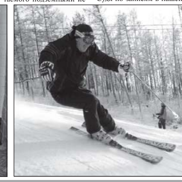
Спуск на лыжах в санатории «Молоковка»