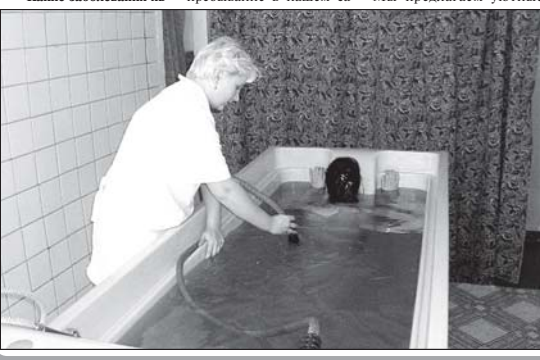
Бассейн в санатории «Молоковка»