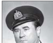
Встречи с ним ждал с восторгом...