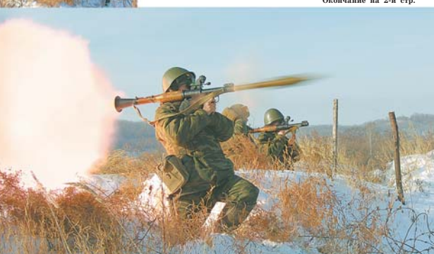
Окончание на 2-й стр.

натометчики приобретают на электронных тренажерах, лазерных имитаторах и пучках приспособлениях учетной стрельбы. Однако, по мнению офицеров пулеметного батальона, тренировочные средства не всегда позволяют создать реалистичную обстановку. Они не воспроизводят агрономические условия выстрела и правильную траекторию полета гранаты. Специально для практических занятий гранатометчиков было оборудовано учебное место недалеко от пункта постоянной дислокации. Оно полностью соответствует требованиям наставлений. «Военнослужащие осваивают РПГ и в совершенстве довольно быстро», - сказал подполковник Сергей Мальшев, - что, в общем, и неудивительно. Ручной противотанковый гранатомет был принят на вооружение в нашей стране ровно пятьдесят лет назад и во многом повторил судьбу автомата Калашникова. Благодаря простоте и надежности, удобству