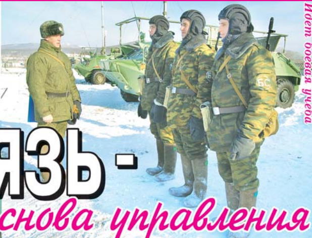
Идут боевая учеба

эфир выходит оператор машины комбрига и связывается со своим коллегой с полевого узла связи командира. Короткий диалог - и на связи с «комбригом» уже «командира» подчиненных подразделений и т. д. Словом, радиотренировка проходит, что называется, в режиме «он-лайн» и охватывает всю бригаду разом.