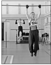
На протяжении шести дней в соответствии с графиком проверки в спортивном комплексе и бассейне, а также на базах дорожных стадионов совмещения морской пехоты около трехсот офицеров штаба ТОФ сдавали нормативы, вымогая упражнения на силу, быстроту и выносливость.

На Тихоокеанском флоте завершилась проверка физической подготовленности военнослужащих управлений, отделов и служб штаба флота