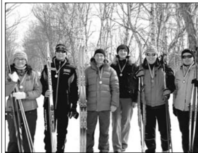
Камчатский край.