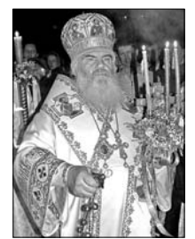
Также воззвано ко всем пастырям и общинам Владивостокской епархии провести по городам и сёлам крестные пасхальные ходы. Дабы исцелась с земли Приморской всякая нечисть и очистилась бы Светом Христова Воскресения наша духовная атмосфера пылью безбожия и безнравственности.

В этот светлый день Пасхи Христовой наше сердце невольно обращается к многострадальной Родине, с древних времён именуемой Русью. О ней наши мысли и чувства, о ней наша тревога и забота. Русь, крестившаяся в великой купели Днепра и проносящая через тысячелетие пасхальную радость о Воскресшем Господе, неужели совсем погрузится в глубокий крах неверия и практического материализма? Народ, который носил Христа в своём сердце и именовался богоносцем, воскреснет ли после своего падения? Ответ на этот вопрос зависит от нас самих. Дай же Бог, чтобы в эти пасхальные пасхальные дни мы почувствовали благодатную силу Воскресшего Христа, встретились бы своими кающимися сердцами навстречу любящему и спасающему нас Господу и твёрдо стали бы на путь духовного преобразования. Да будет так! Да воскреснет Русь и нравственно преобразится дети её, и да бежат от лица её ненавидящие её!