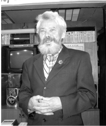
Держись, геолог! Крепись, геолог! Ты солнцу и ветру брат.