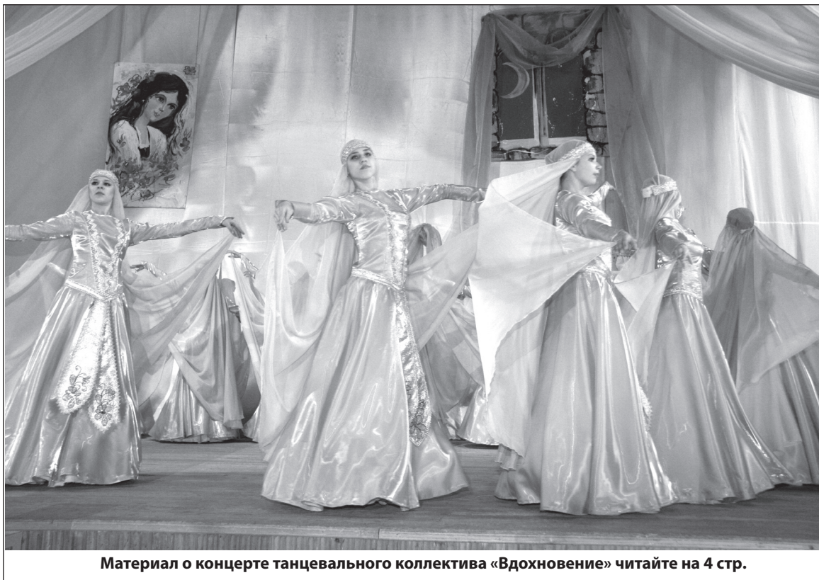
Материал о концерте танцевального коллектива «Вдохновение» читайте на 4 стр.

Отсидимся дома - завтра будем платить ещё больше, но роптать в этом случае надо будет только на себя! Все на митинг! Организатор митинга С.М. ПЛЕВАКО.