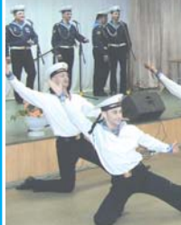
Ансамбль песни и пляски ТОФ в наших краях - гость не частый...