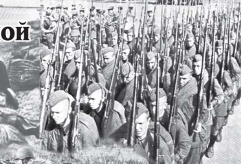
этом высокое боевое мастерство. При её активном участии были освобождены города Осиновки, Бобруйск, Барановичи, Слоним. В конце июля участвовала в освобождении города Бреста. В начале сентября вышла к реке Нарва и участвовала в захвате плацдарма в районе Серича.

В январе - апреле 1942 года 413-я стрелковая дивизия участвовала в спас-демонском направлении (Ярево-Вяземская операция). С конца апреля 1942-го до июля 1943 года вели оборонительные бои в районе юго-западные Козельск. В июле - августе 1943 года она с боями продвинулась к реке Сухо, участвовала в Явненской (Орловская наступательная операция), а 16 августа освободила город Жидара.