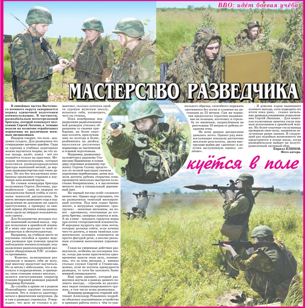
ВВО: идёт боевая учёба

В соединениях и частях округа проходит месячник безопасности военной службы, основными задачами которого стали повышение ответственности всех должностных лиц за сохранность жизни и здоровья подчиненных, предотвращение причин и предпосылок гибели и травматизма личного состава воинских частей округа. В воинских частях и подразделениях идут многочисленные организационные, информационные, инструкторско-методические и показательные занятия с участием представителей командования округа. В войсках округа уже прошел день пожарной безопасности, в планах проведение дней экологической и электробезопасности, санитарно-эпидемиологического обеспечения и недели безопасности дорожного движения. Особое внимание уделяется работе по обеспечению деятельности личного состава в ходе боевой подготовки войск, при эксплуатации и работах на технике, несении службы в караулах, обращении с оружием, боеприпасами и взрывчатыми веществами. Месячник завершится 1 августа 2011 г. Подготовил Сергей РОМАНОВ, «Суворовский натиск».