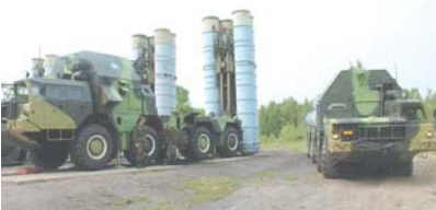
Такие высокие результаты становятся возможны благодаря обширному дальневосточному зенитным ракетным полкам. На их плечах лежит ответственность за выполнение поставленной задачи, за принятие непростых решений в учебно-боевых условиях и за контроль их выполнения.