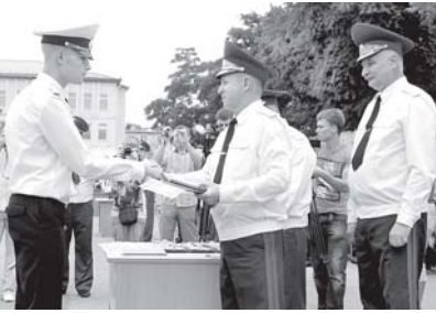
Всю неделю в Примурье изымало от жары. Столбик термометра подбирался к отметке +30°C, упрямая влажность давила первыми рубезь 90 процентов. По климатическим соображениям торжественное построение было решено перевести на более раннее время, чтобы успеть до установления зноя.

В Владивостоке имени Маршала Советского Союза Е.К. Раевского, которое с недавнего времени является филиалом Военного учебно-научного центра Сухопутных войск РФ «Облагодская академия Вооружённых сил Российской Федерации», состоялся 98-й курсантский выпуск. Дипломы и награжденные знаки получили 375 молодых лейтенантов. Кроме того, более двух десятков иностранных военных специалистов из семи стран, обучающихся по программе международного военного сотрудничества, завершили полный пятнадцатилетний цикл подготовки. На торжественной церемонии им были вручены дипломы и специальные сертификаты.