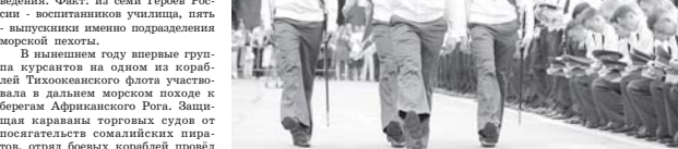
Серьёзной проверкой сил государственный экзамен по физическому подготовке, где комиссия оценивала не только природные данные выпускников, но и их теоретическую подготовку в сфере различных профильных нормативных и руководящих документов. Вообще, дружба со спортом - один из знаменитых картоек училища. Курсанты «рокоосовцы» - участники практически всех крупных региональных соревнований по самым разным дисциплинам.