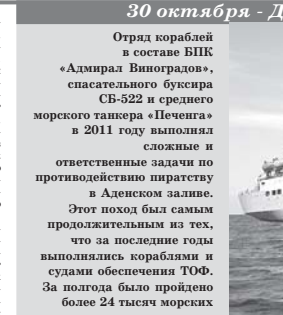
Отряд кораблей в составе БПК «Адмирал Виноградов», спасательного буксира СВ-522 и среднего морского танкера «Пенчуга» в 2011 году выполнял сложные и ответственные задачи по противодействию пиратству в Аденском заливе.

По просьбе офицеров принимающей стороны организовали им экскурсию на «Пенчугу», показав ходовую рубку, провели на капитанский мостик, спустились в машинное отделение, а также подготовили слайд-шоу. Кроме того, по просьбе гостей была организована выставка вооружения, которая находилась на борту в ведении морских пехотинцев.