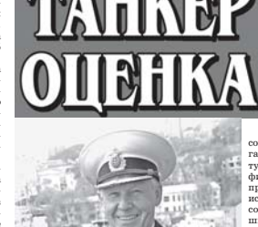
Этот поход был самым продолжительным из тех, что за последние годы выполняли кораблями и судами обеспечения ТОФ.