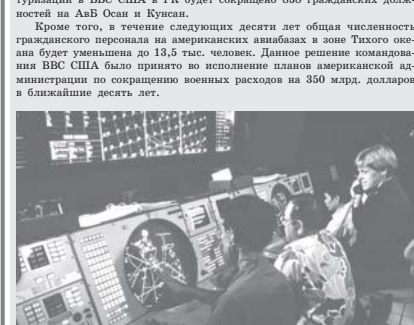
Подготовлено Валерий ПЕТРЕНКО. (Окончание следует).