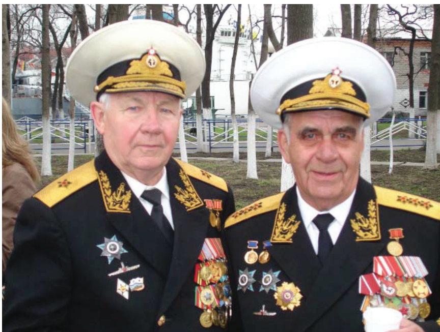
Адмирал Г.А. Хватов (справа), контр-адмирал А.В. Макаренко, День Победы, г. Владивосток, 2006 г.

Материал Петра Пузина «Подводные мили капитана субмарины» читайте на с. 40