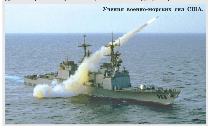
Учения военно-морских сил США.

Министерство обороны США обнародовало план сокращения оборонных расходов в 2013-2017 фин.г. Так, в течение последующих 5 лет с целью высвобождения дополнительных финансовых средств планируется сократить оборонный бюджет на 259 млрд. долларов.