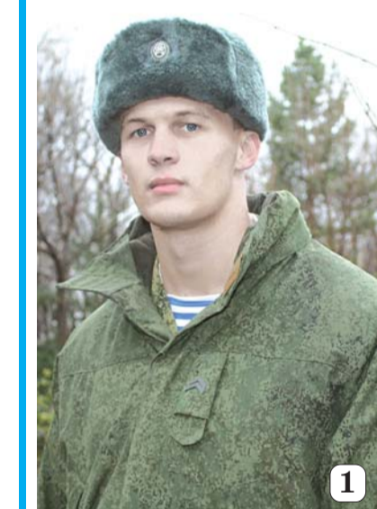
1. Служат здесь и солдаты-контрактники, участники прежних локальных войн.

Среди тех воинских коллективов, кто весьма успешно завершил учебный год, и Уссурийская бригада специального назначения. Это соединение имеет славную боевую летопись. И основу её офицерского ядра составляют профессионалы, прошедшие в недалёком прошлом чеченскую войну. Бывшие командиры взводов и рот ныне возглавляют батальоны, передавая бесценный боевой опыт молодым во-