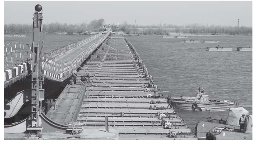
На снимке: выполнение норматива по РХБЗ.