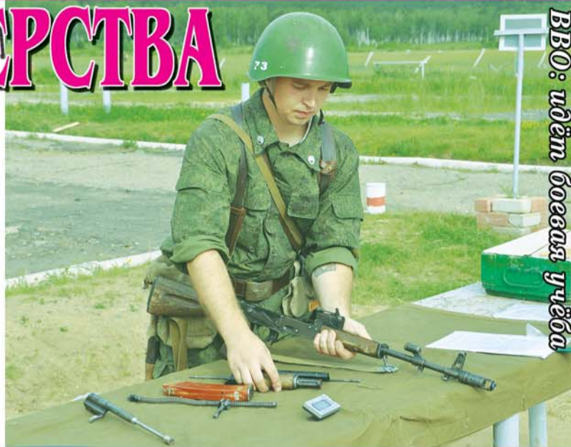
ВВО: идёт боевая учёба