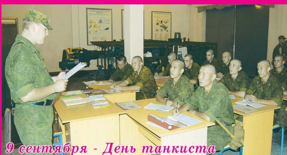
9 сентября - День танкиста

ГАЗЕТА ОРДЕНА ЛЕНИНА КРАСНОЗНАМЕННОГО ВОСТОЧНОГО ВОЕННОГО ОКРУГА