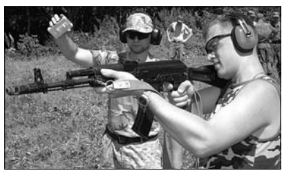
Военный прокурор разгласяет