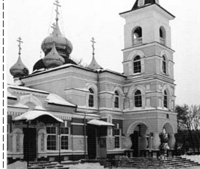
Свято-Николаевский кафедральный собор во Владивостоке.

мышлением и всеми моими чувствы; и во исходе души моея помози ми, окаянному, умоли Господа Бога, всея твари Создателя, избавити мя воздушных мытарств и вечного мучения; да всегда прославлю Отца и Сына и Святаго Духа, и твоё милостивое предстательство, ныне и присно и во веки веков. Аминь.