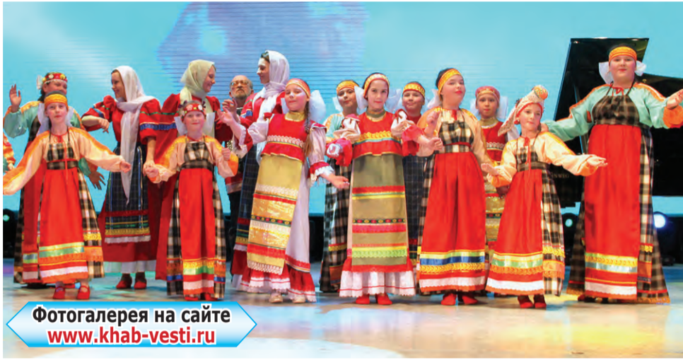
Фотогалерея на сайте www.khab-vesti.ru

Подробнее о фестивале «Рождество глазами детей» читайте в выпуске «Культура».