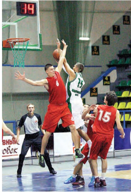
(Китай). Приглашаем болельщиков поддержать наших баскетболистов. Начало игр в 15 часов.

Сегодня в спортивном комплексе «Авангард» состоятся финальные матчи Международной студенческой баскетбольной лиги. Соперниками ТОГУ, представляющего Хабаровск, являются команды из Красноярска, Приморского края и сборная провинции Хэйлунцзян