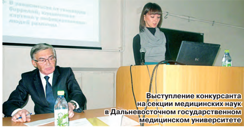
Выступление конкурсанта на секции медицинских наук в Дальневосточном государственном медицинском университете

В Хабаровске завершился 15-й конкурс молодых ученых, который проводится ежегодно в преддверии Дня российской науки.