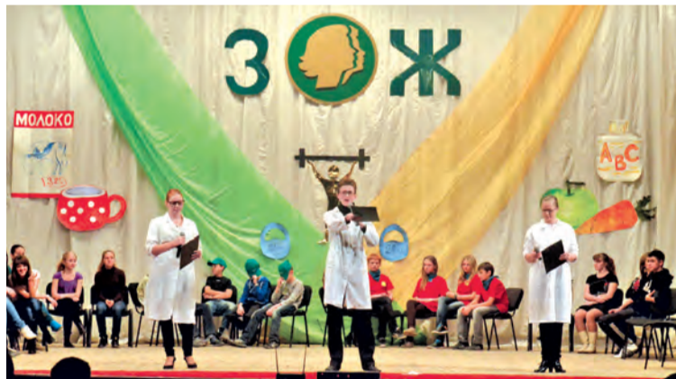
Клуб «Здоровый образ жизни» — одна из популярных форм социальной работы

● Вызывают на ковер. Открытый турнир Южного округа по вольной борьбе в честь мужского праздника состоится 23 и 24 февраля. Соревноваться борцы будут в Хабаровском краевом центре художественного развития детей и юношества (ул. Ургальская, 25). Начало в 10.00.