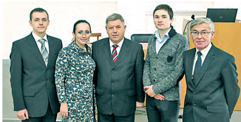
Профессора ДВГМУ и победители медицинского конкурса

Перемены происходят в секции медицинских наук. Все больше молодых ученых проводят прак-