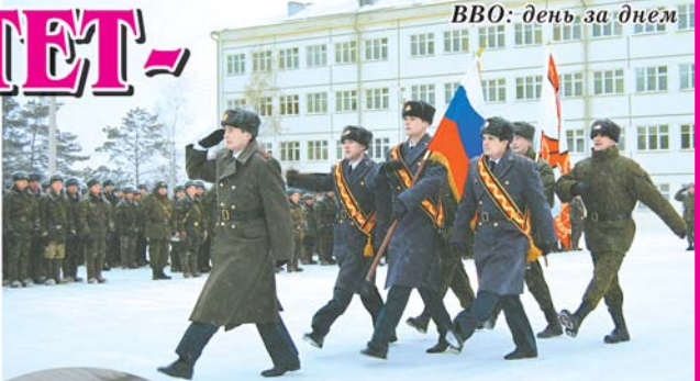
ВВО: день за днем

Сегодня военнослужащие, участвовавшие в крупнейших маневрах Вооруженных сил РФ, стали уже старослужащими. По мнению командиров, опытные младшие командиры и рядовые будут хорошими помощниками в обучении молодого пополнения. Впрочем, благодаря изменениям в программе боевой подготовки созданы старшего звена по времени увольнения в запас также смогут повысить свой профессионализм. Новый учебный год предполагает усложнение программы полевых выходов и тактических учений, более тщательное слайзинг рог, батальонов и бригад в целом. В числе поставленных задач - обучение и совершенствование тактической подготовки.