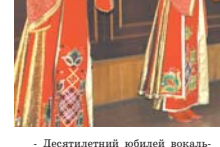
Воскресенье 11 декабря. На снимке: на сцене вокальной группы «Исток».

Что же касается творческой деятельности, то еще на слуху наша победа 2009 года на фестивале «Ка-